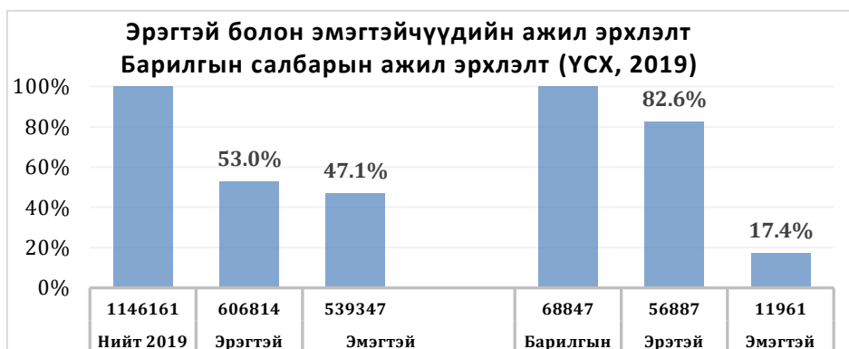
Зураг 1. Барилгын салбар дахь эрэгтэй, эмэгтэй ажилчдын харьцаа

Барилгын салбар дахь эрэгтэй болон эмэгтэй ажилчдын хоорондын цалингийн ялгаа судалгаануудын үр дүнгээс илт харагдаж байна. Эмэгтэйчүүдийн хувьд барилгын салбар дахь ажлын байр нь цалингийн хувьд бусад салбартай харьцуулахад өндөр байдаг байна. Доорх Зураг 2-т харуулснаар, 2019 оны байдлаар эмэгтэй болон эрэгтэй хүмүүсийн цалингийн хэмжээ хоорондоо ялгаатай буюу улсын дунджаар эмэгтэйчүүд эрэгтэйчүүдийн цалингийн 84%-тай тэнцэх хэмжээний цалин авч байна. Харин барилгын салбарт ажилладаг эмэгтэйчүүдийн тоо харьцангуй цөөн боловч дундаж цалингийн хэмжээгээр эрэгтэйчүүдээс яльгүй өндөр буюу 3% илүү байна. Энэ нь барилгын салбарт ажиллаж буй эмэгтэйчүүдийн ихэнх хэсэг нь мэргэжлийн ур чадвар өндөр шаарддаг ажил эрхэлдэг бөгөөд эдгээр ажил нь нийт барилгын салбарын дундаж цалинтай харьцуулахад өндөр байдагтай холбоотой юм. Ус хангамж, ариутгах татуургын салбарт эрэгтэй болон эмэгтэйчүүдийн дундаж цалин ойролцоо (эрэгтэйчүүдтэй харьцуулахад 0.96%) байгаа бол эмэгтэйчүүд Тээвэр ба агуулахын үйл ажиллагаа (1.13%), Уул уурхай болон олборлолт (1.09%), Удирдлагын болон дэмжлэг үзүүлэх үйл ажиллагаа (1.08%)-ны салбаруудад эрэгтэйчүүдээс дунджаар өндөр цалин авч байна.